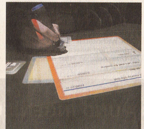
Auf dem interaktiven digitalen Tisch können projizierte Dokumente bei Besprechungen gemeinsam bearbeitet werden.